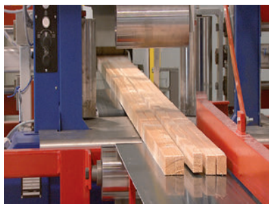
> SORTIE DE BOIS CALIBRÉS EPAISSEURS DE 9 À 450 MM