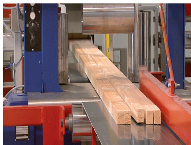
> SORTIE DE BOIS CALIBRÉS EPAISSEURS DE 9 À 450 MM